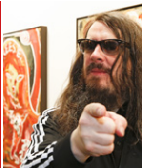
Jonathan Meese

24.02.2018, 11:30 Uhr art KARLSRUHE-Preis